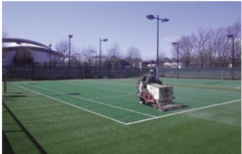
人工芝施工中の現場