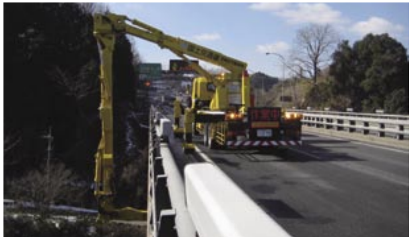
鋼桁応急対策工：亀裂除去作業

今回の工事は、奈良国道事務所の奈良維持出張所管内全路線が対象の施工区間になっています。その中で、90%近くのウエイトになる国道25号名阪国道を紹介したいと思います。