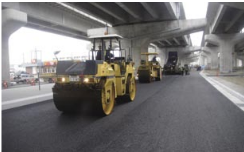
排水性舗装施工状況