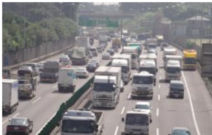
交通量日本一とパトシーくん

国道246号・16号・保土ヶ谷バイパスの3路線総延長40kmの道路維持管理作業を行う工事です。社員・協力会社の全メンバーが使命感に燃え、これらの道路を365日守っています。主な業務は巡回パトロール、交通事故処理、落下物回収、ガードレール修理、ポットホール処理、苦情対応、災害復旧、舗装です。「みちの相談室」が出来てからは、大忙しの日々ですが、社員一丸となって業務に励んでおります。