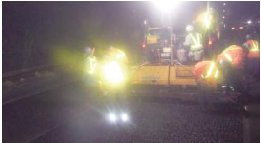
針インターチェンジ付近 上り追越車線 舗設状況

発注者 国土交通省 近畿地方整備局 奈良国道事務所 施工場所 奈良県山辺郡山添村運瀬～奈良市針町 工期 H19. 8.8～H20. 2.29 現場代理人 竹中 信喜