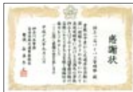
神奈川県警高速隊からの感謝状