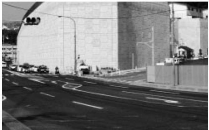
施工箇所 フィドラーズグリーンの前面より撮影

また市道・県道に給水管・排水構造物を設置するため、現道部の昼夜間規制・進入路工事は他の工事用道路となっており、道路幅が狭く毎日が緊張の連続です。