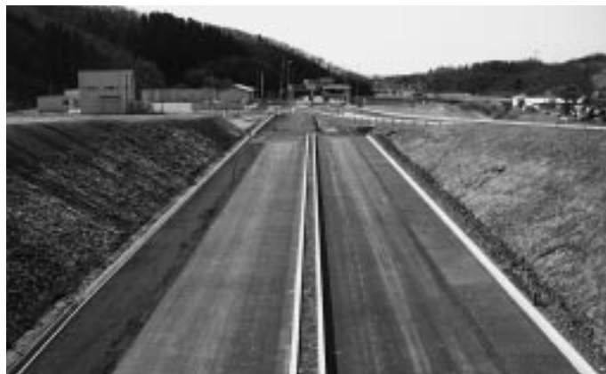
二古トンネル: 施工幅員8.61mで施工

秋田県内では今年の夏に向け各所で高規格道路が整備されています。本工事は、日本海沿岸東北自動車道 岩城IC～仁賀保IC (L=33.8km) の内、岩城ICより3.1kmの区間を施工しています。