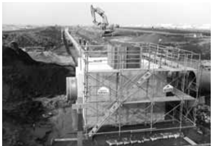
パトロールで「あの建物は?」と聞かれましたが…排水棟です。

全体の工事は盛土だけでも約10万m 3 あったのですが、昼夜の施工で順調に終了。3月は舗装工、緑地工の施工にて完成への